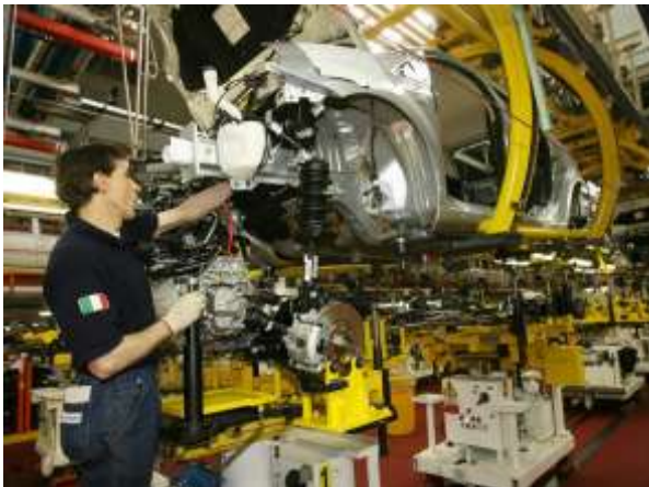
Una fabbrica di automobili