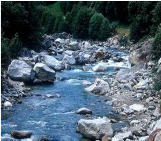
l'acqua del ruscello