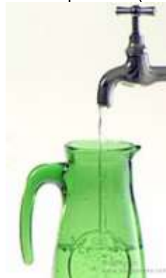
acqua del rubinetto: paghiamo per averla