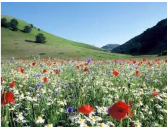
fiori di campo: tutti li possono raccogliere