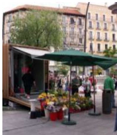
Fioraio: per comprare i suoi fiori dobbiamo pagare