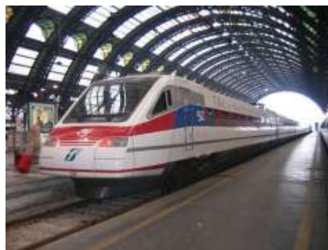
un'impresa di trasporti ferroviari