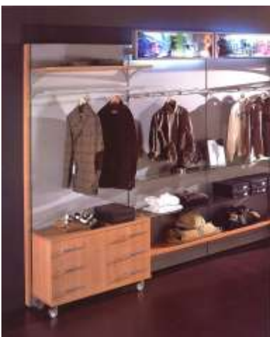
Un negozio di abbigliamento